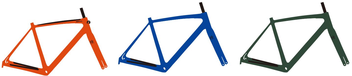
グロスメタリックカラー