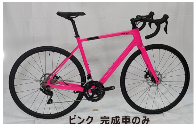
ピンク 完成車のみ