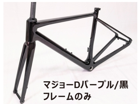
マジョーDパープル/黒 フレームのみ