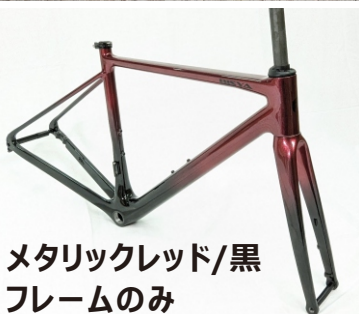
メタリックレッド/黒 フレームのみ