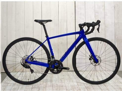
ブルーメタリック