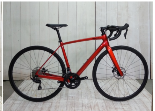
オレンジメタリック