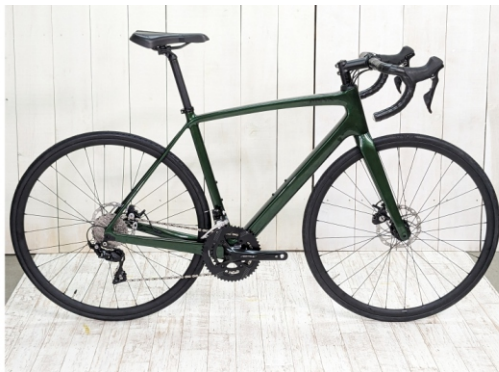
Dグリーンメタリック