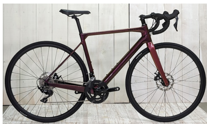
マジョーラレッド